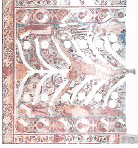
L'Albero della Croce o della Vita Santuario di S. Maria del Casale