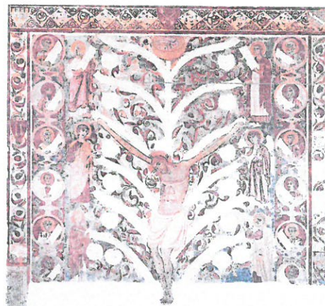
L'Albero della Croce o della Vita Santuario di S. Maria del Casale

Centro di Spiritualità “Madonna della Nova” - OSTUNI -