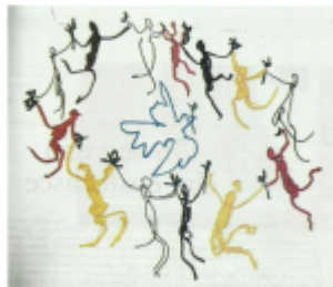
Pablo Picasso, Danza della giovinezza (1961)

ci guiderà nella lettura del "discorso sulla comunità" del Vangelo di Matteo